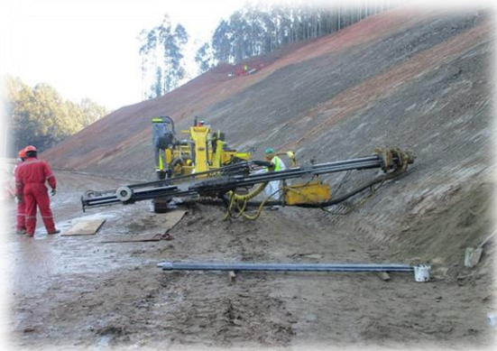
Colocación de drenes californianos, corte sector Chivilingo.

• Además incluye obras como: Mejoramiento de Estructuras Existentes, Construcción de Puentes, Pasarelas, Pasos Desnivelados, Nuevos Enlaces, Obras de Saneamiento, Señalización y Seguridad Vial, Iluminación, Paraderos Peatonales, Áreas de Servicios y aproximadamente 13 km de Calles de Servicio. Igualmente incorpora los baipás de Lota, Laraquete y Villa Los Ríos.